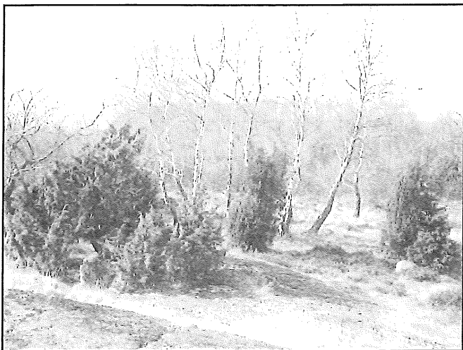
Norra delen av Norra skär innan avverkningen påbörjats.

cm snö, så det blev rätt så besvärliga förhållanden för folket som var här och jobbade.