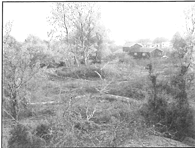
Partiet nordost om vår tomt under pågående röjning.

det som växer här på ön har man ringbarkat och de ska fällas om ca tre år när träden har dött.