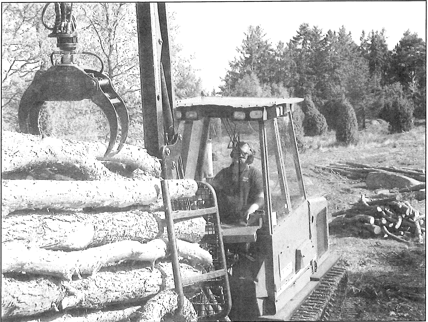
Skotaren i arbete.