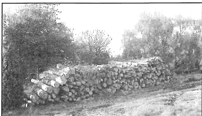
Tremeterslängder på en av upplagsplatserna.

Någon av de första dagarna i april hörde jag motorsågarna på Norra skär, och där finns det verkligen mycket att röja av.