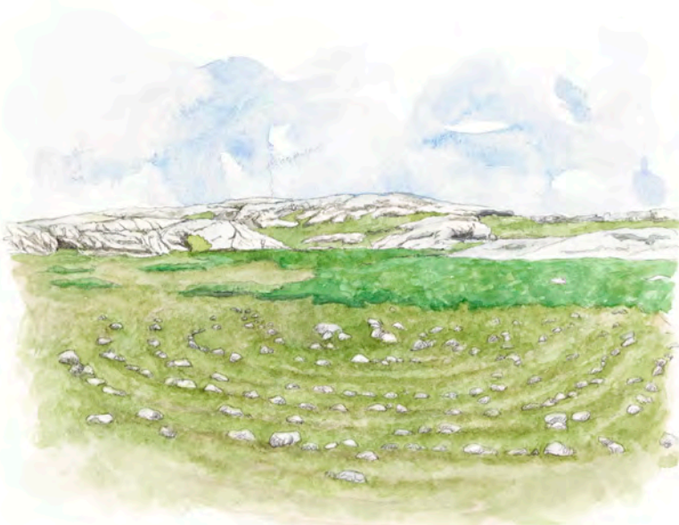
Labyrinten vid Sandviken