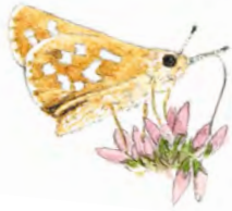
Silversmygare, Hesperia comma

I naturreservatet finns två motionsslingor som är markerade med gula respektive blå stenar. Slingorna överensstämmer i stort sett med de gamla "mjölkeväja", som byns kvinnor trampade upp under den tid då djurhållningen var en viktig del av öns ekonomi. Vid Möddalen passerar du en snäckskalsbank som bildades då ön ännu låg under vattenytan. Den kom i dagen vid landhöjningen efter den senaste istiden. Här hämtade öborna förr hönsens behov av snäckskal. På ön finner du många fina ställen att bada på, allt från vita barnvänliga sandstränder till klippor.