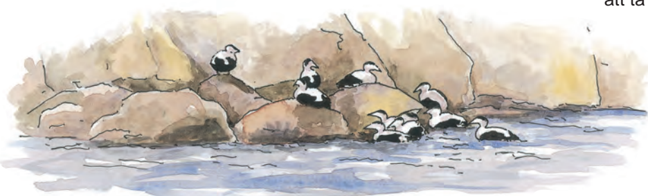
Ejder, Somateria mollissima

Rörö är en bra rastlokal för flyttfåglar och ett stort antal arter passerar ön varje år. Mellan Sandvikarna och Tåviken kan dyningen ibland bjuda på ett storlaget skådespel med vattenkaskader i skummande pelare mot skyn. Där mitt i de häftiga vindbyarna hänger trutarna (gale), otroligt överlägsna ejdrarna. Ejdrarna (erera) har stora problem med vinden. De kan komma ur kurs och ha all möda att klara sträcket förbi bergen. Detta utnyttjades förr då jakt på sjöfågel var ett sätt att skaffa kött i grytan som omväxling till fiskdieten. Vinden drev nämligen fåglarna inom skotthåll för skyttarna. Andra fågelarter att hålla utkik efter är tretåig mås (regnsky) och havssula (bergsman).