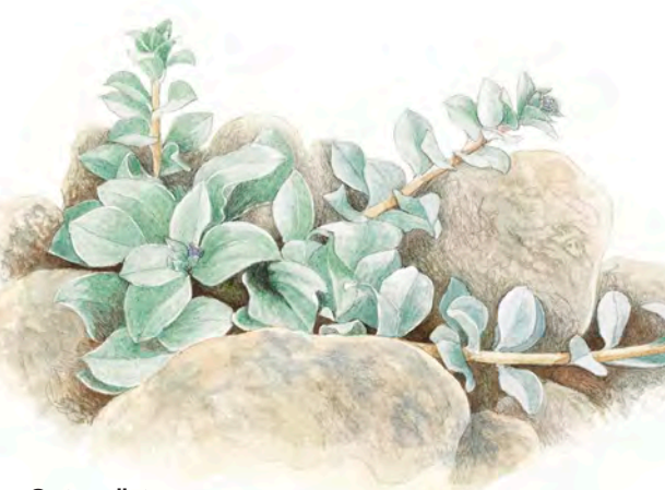
Ostronört, Mertensia maritima

Vid Sandviken och Tåviken finns många havslevande arter. Den sandiga botten täcks av det livsviktiga ålgräset. Ålgräsängar är barnkammare för bland annat torsk, rödspätta och kräftdjur.